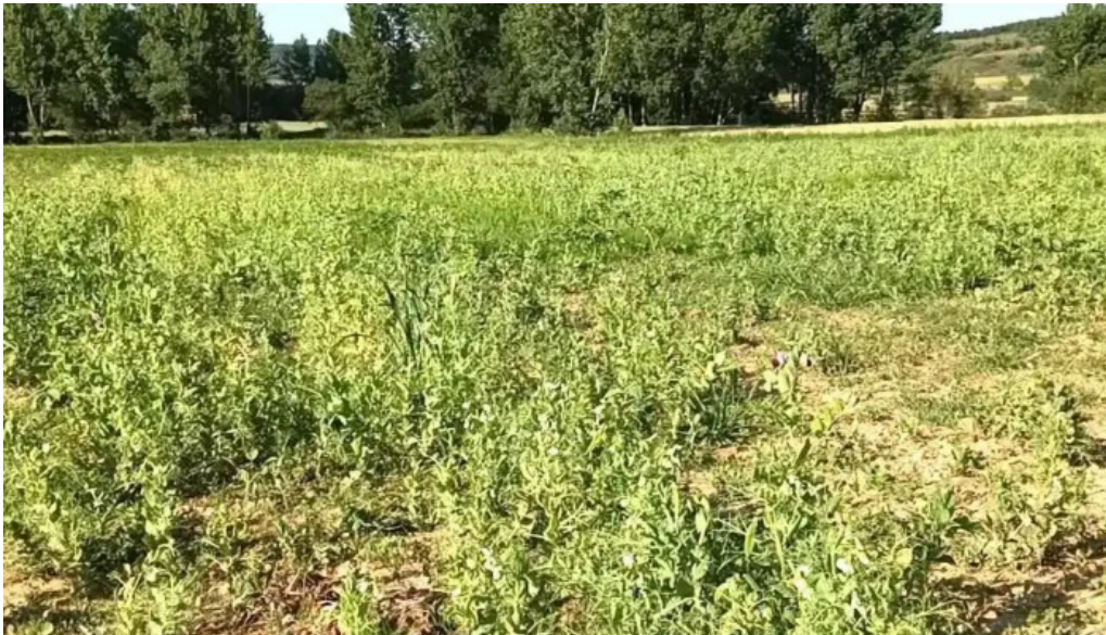
Ayuntamiento de valle de valdelucio videos