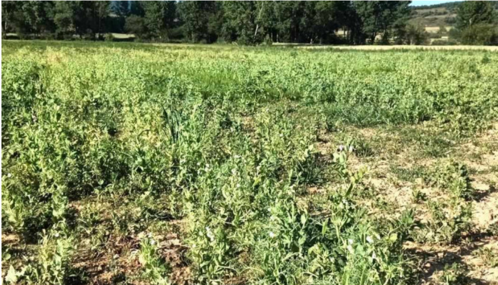
Ayuntamiento de valle de valdelucio fotos