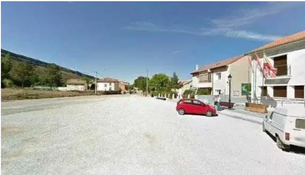
Ayuntamiento de valle de valdelucio fotosdeg