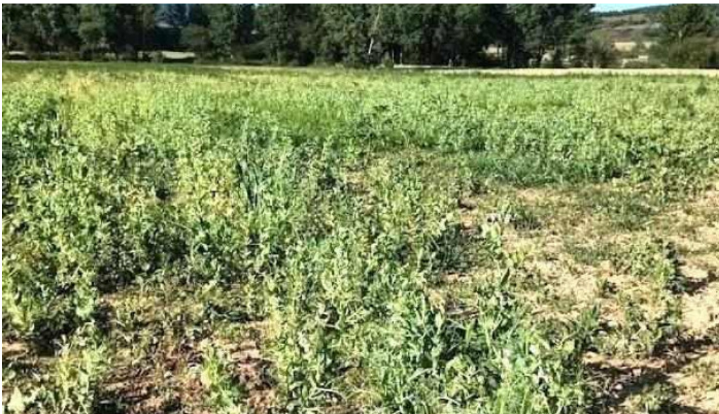
Ayuntamiento de valle de valdelucio quintanas de valdelucio