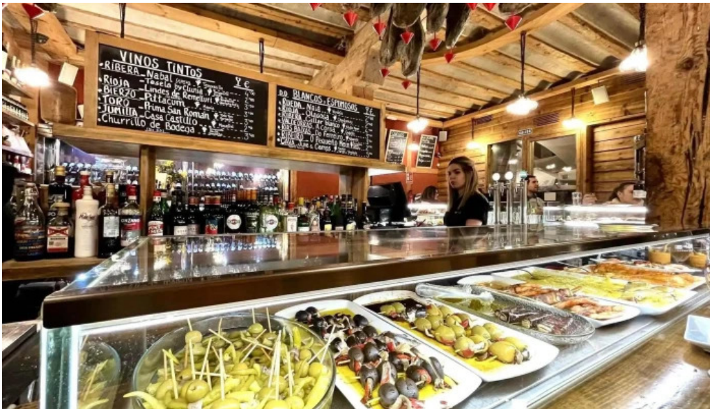
La favorita burgos comida y bebida