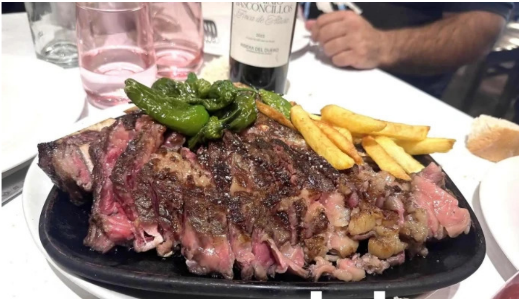
La favorita burgos filete