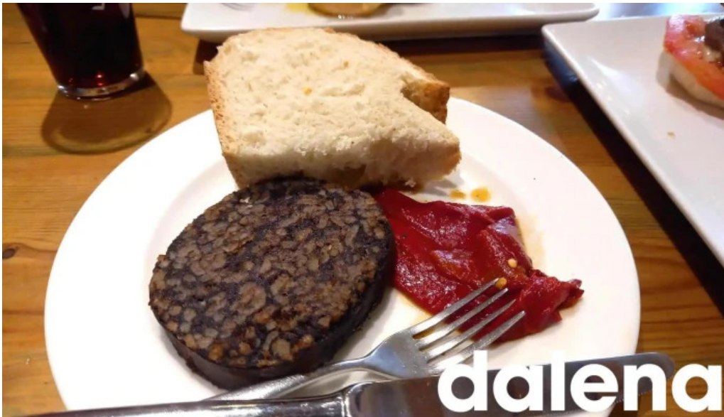
La favorita burgos morcilla