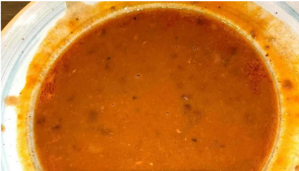
La favorita burgos cerca de mi