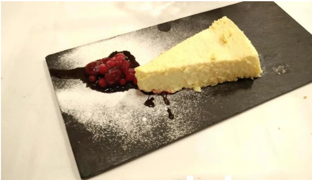
La favorita burgos pastel de queso