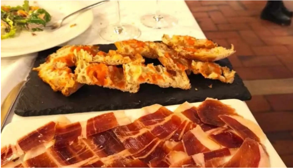
La favorita burgos prosciutto