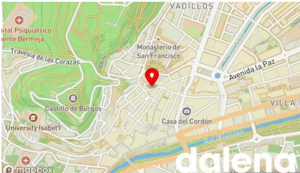
La favorita burgos mapa