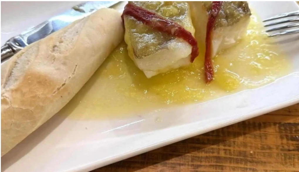
La favorita burgos mas recientes