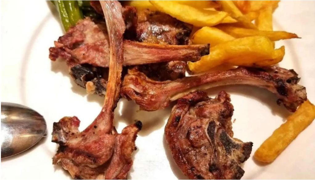
La favorita burgos churrasco