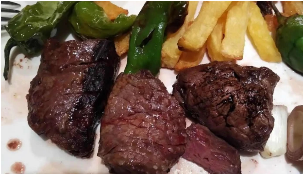
La favorita burgos filet mignon