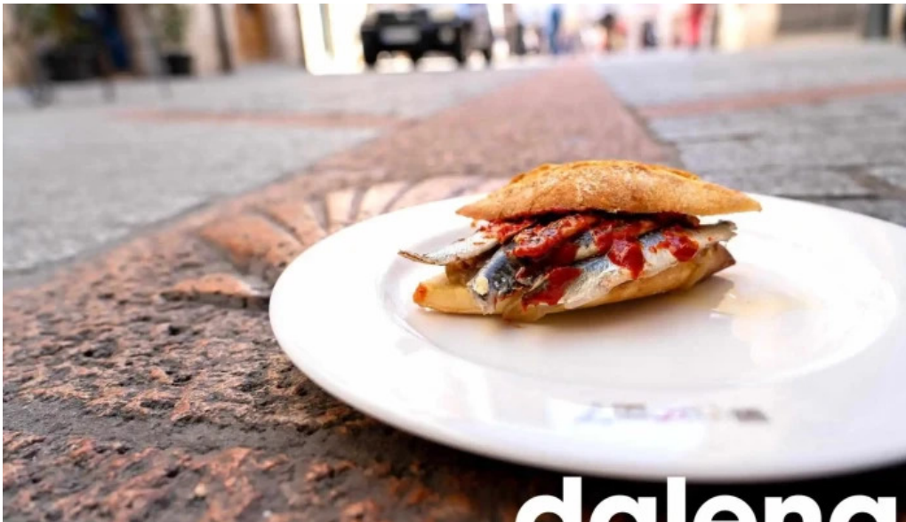
La favorita burgos del propietario