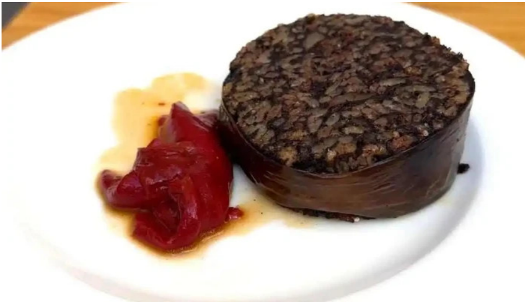
La favorita burgos videos