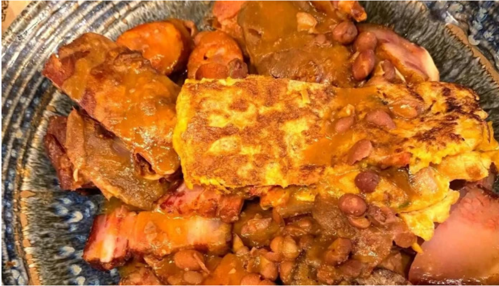
La favorita burgos zona