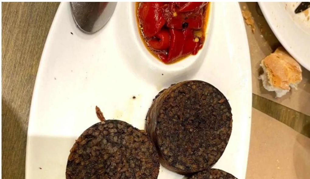
La favorita burgos horario