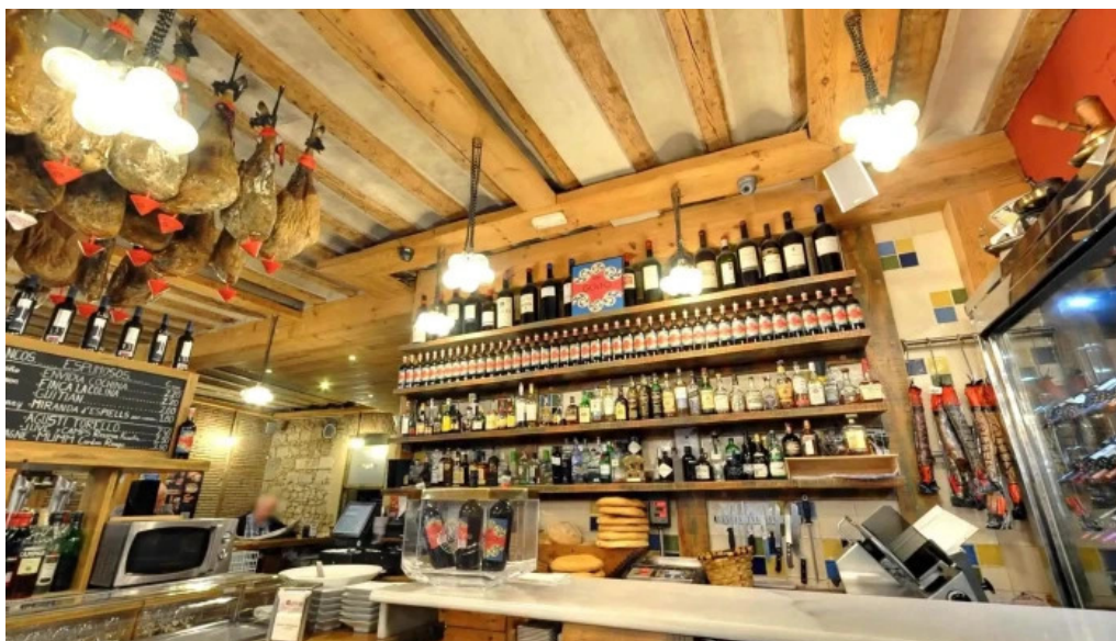
La favorita burgos ambiente