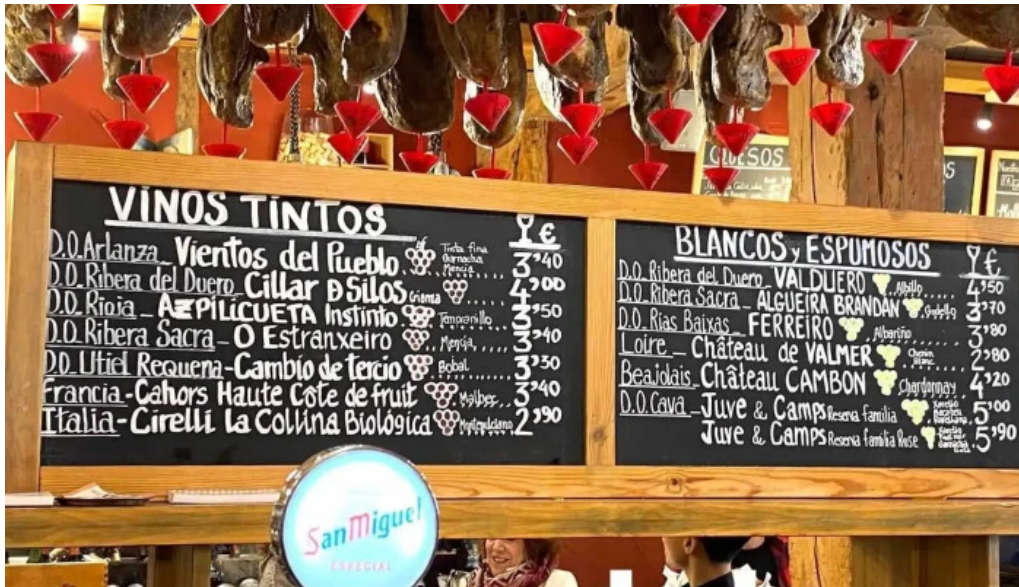
La favorita burgos carta