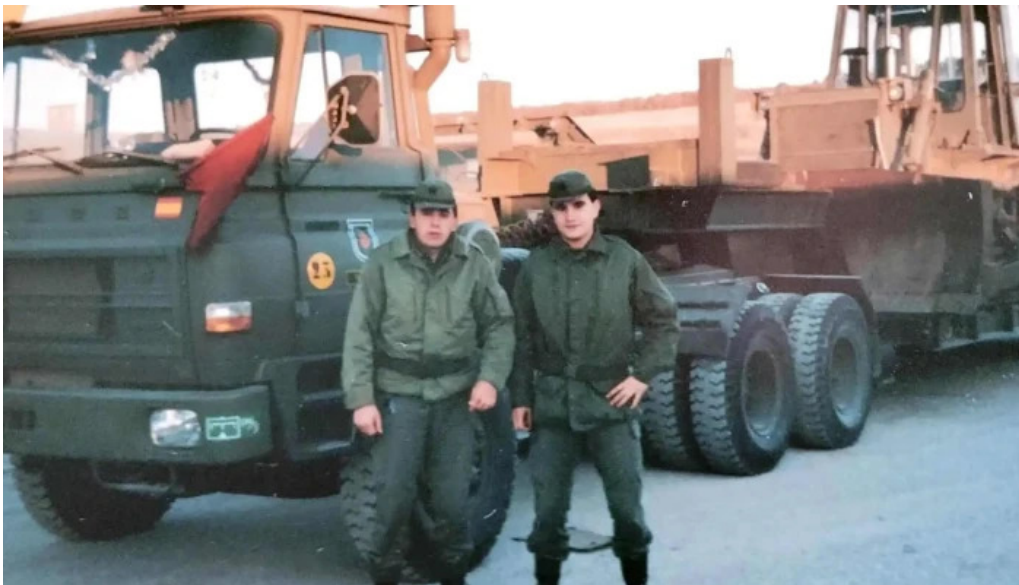
Base militar cid campeador opiniones