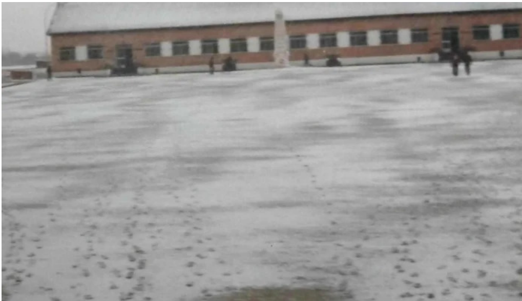
Base militar cid campeador castrillo del val