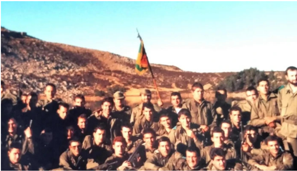
Base militar cid campeador puntaje