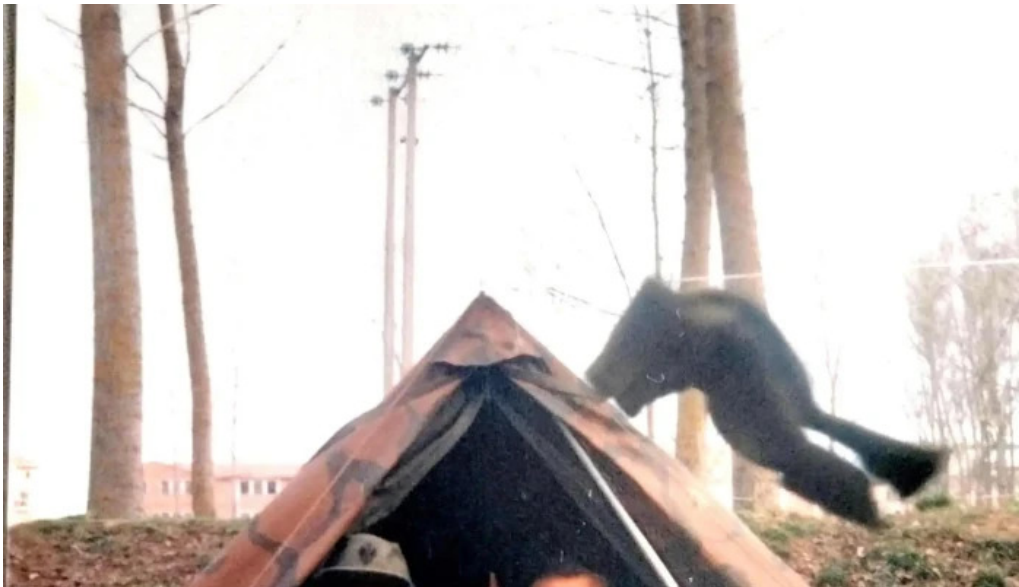
Base militar cid campeador numero