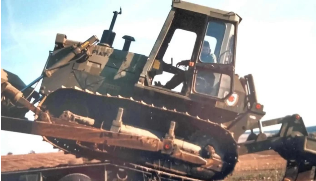
Base militar cid campeador donde