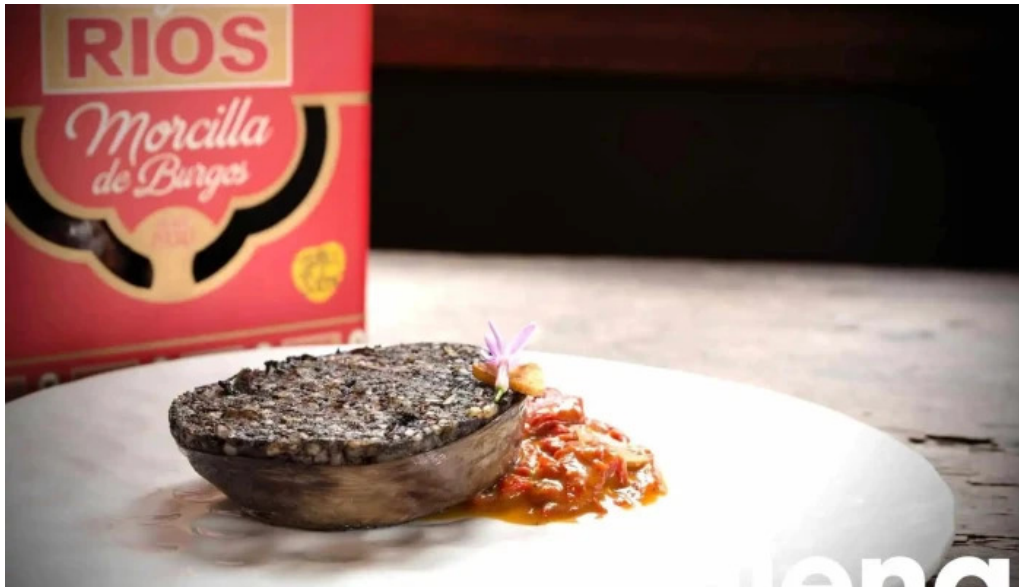
Embutidos rios morcillas de burgos tradicionales instagram