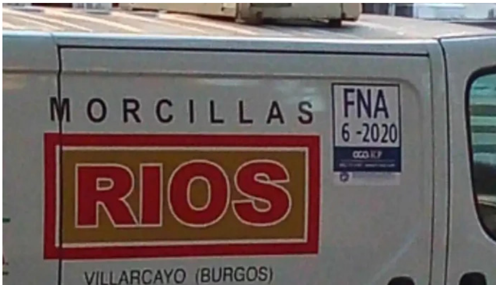
Embutidos rios morcillas de burgos tradicionales edificio