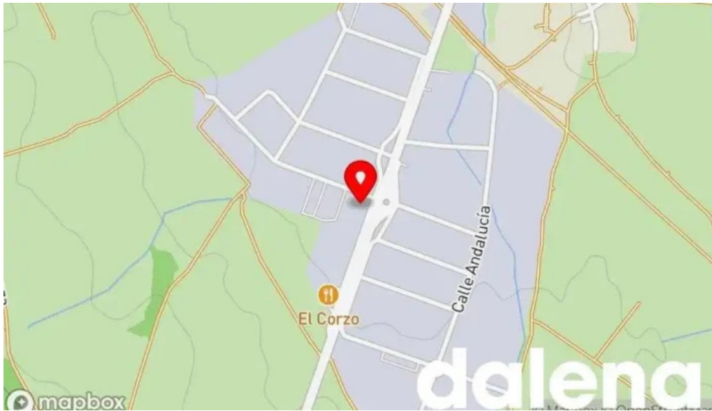
Embutidos rios morcillas de burgos tradicionales mapa