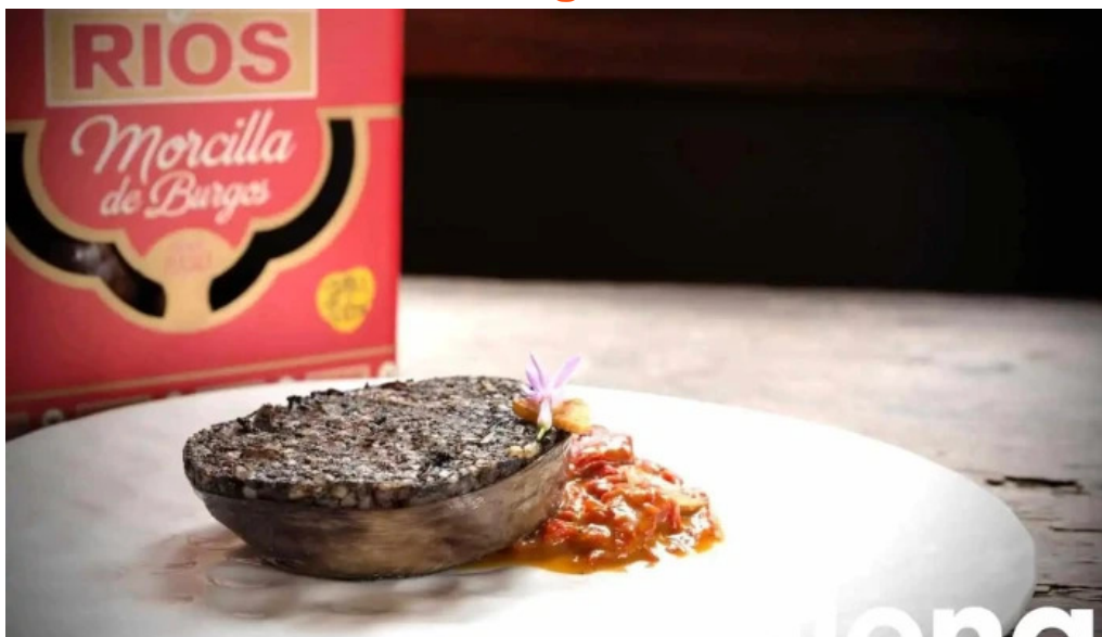
Embutidos rios morcillas de burgos tradicionales burgos