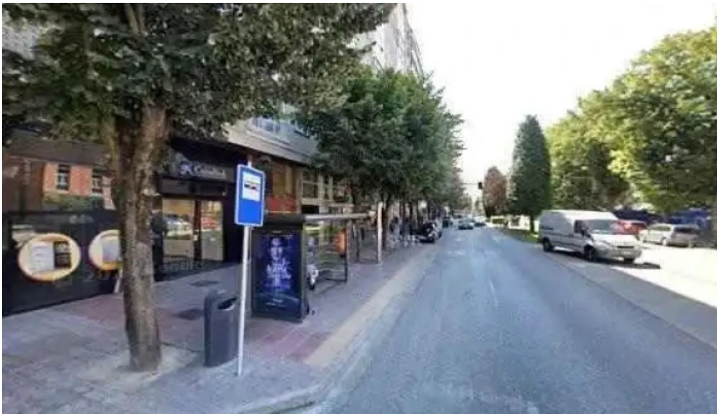
Frutopia avenida del cid ubicacion