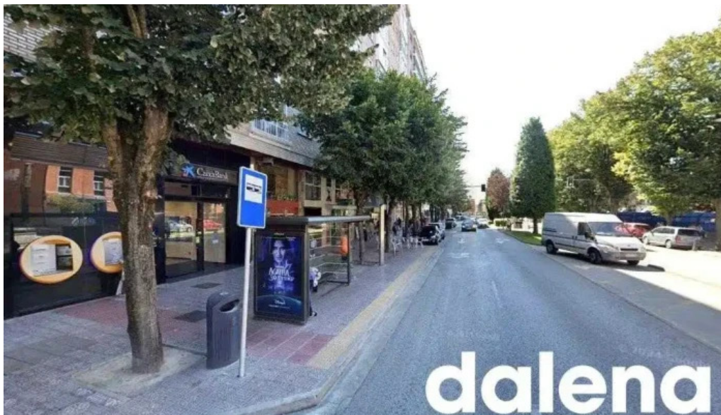
Frutopia avenida del cid burgos