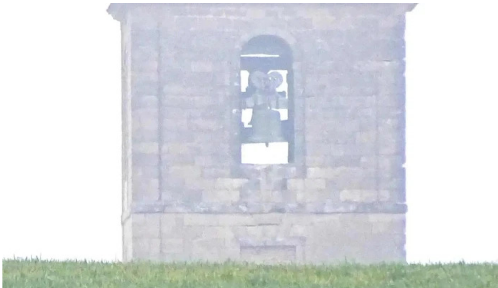
Iglesia de san pedro apostol instagram