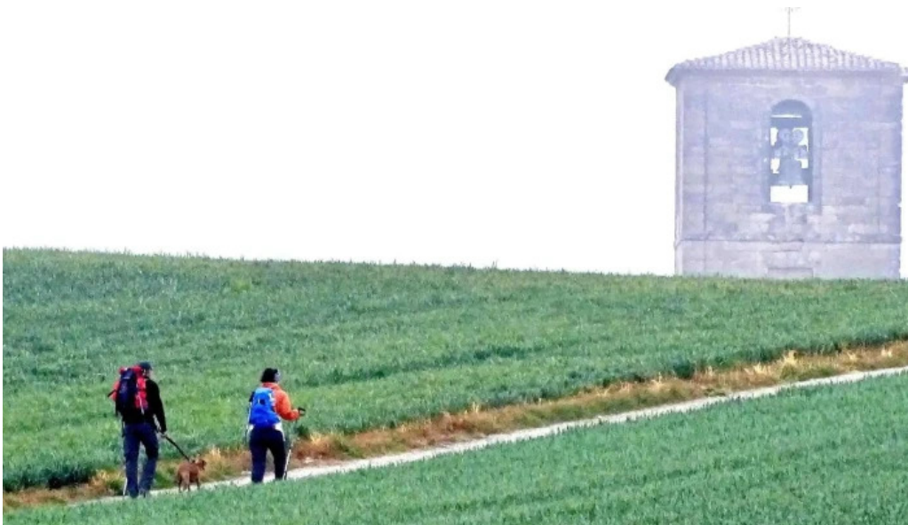
Iglesia de san pedro apostol fotos