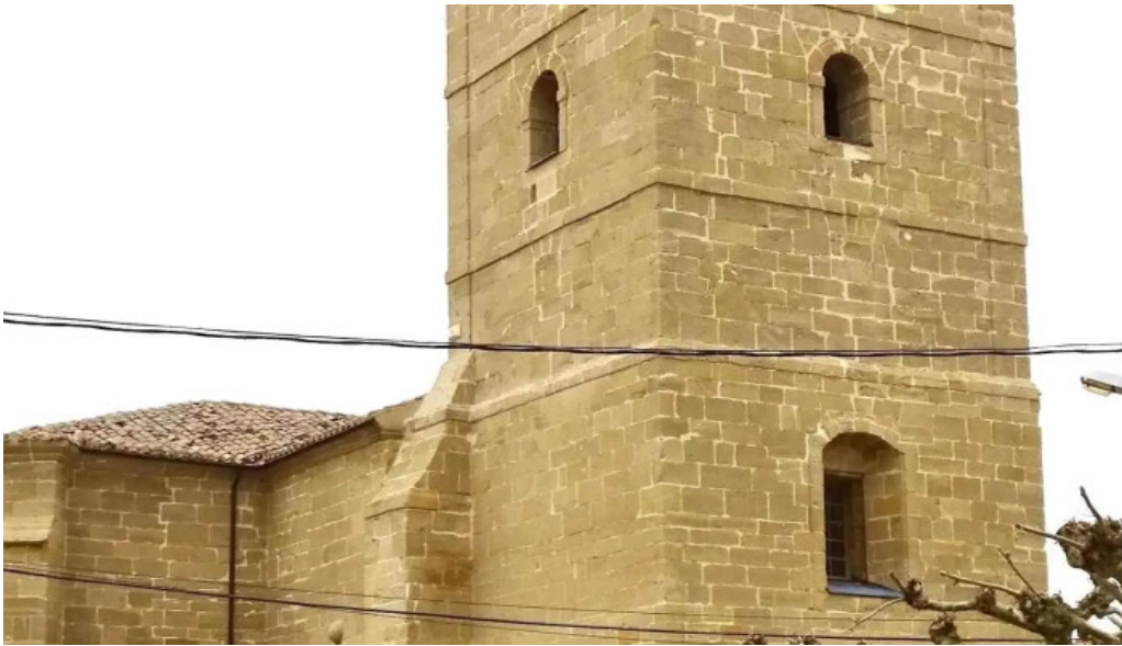
Iglesia de san pedro apostol iglesia