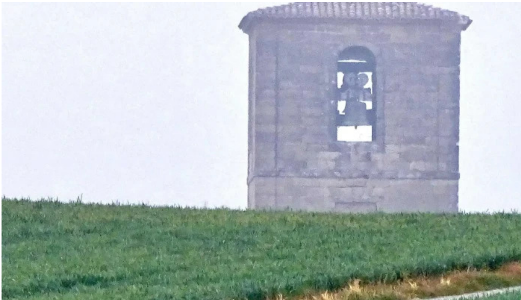
Iglesia de san pedro apostol descuentos