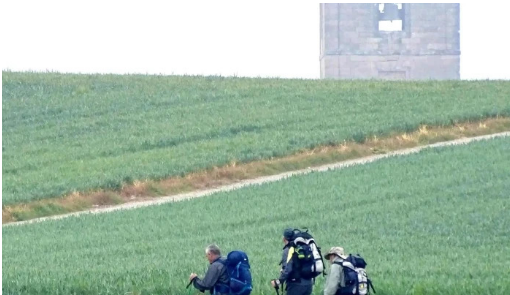
Iglesia de san pedro apostol castildelgado