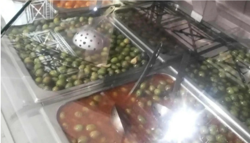
Plaza de abastos interior