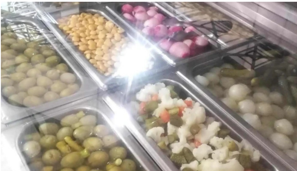
Plaza de abastos puntaje