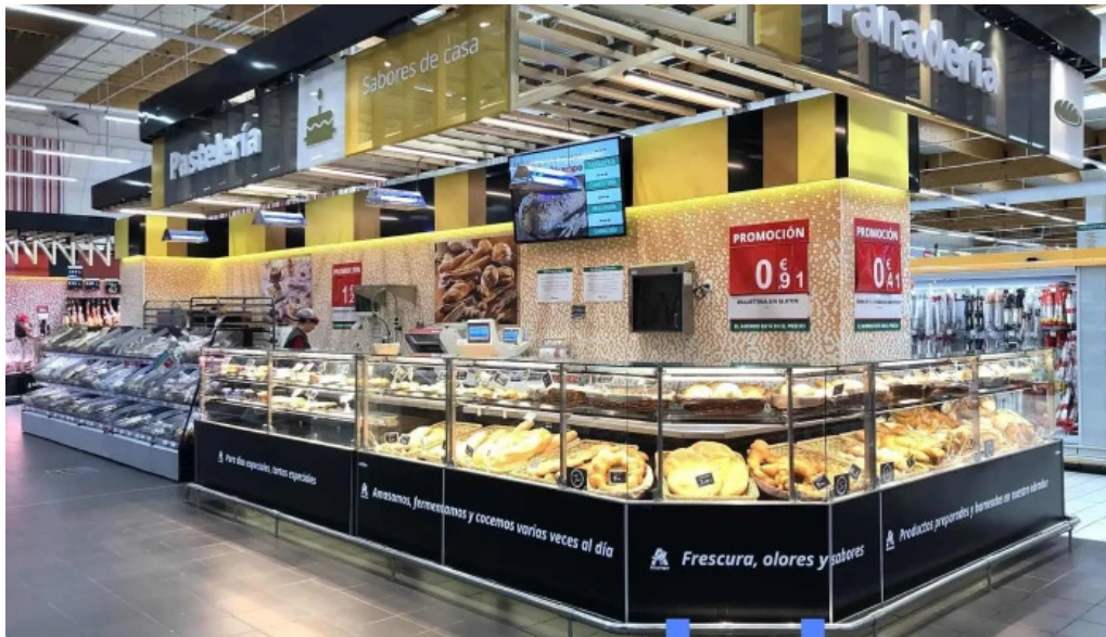
Alcampo del propietario