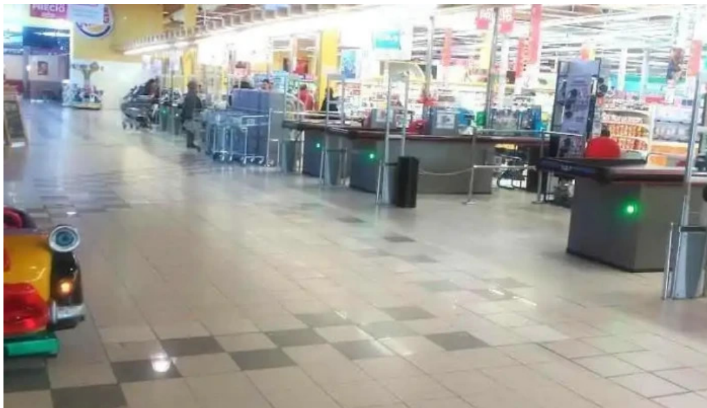
Alcampo aranda de duero