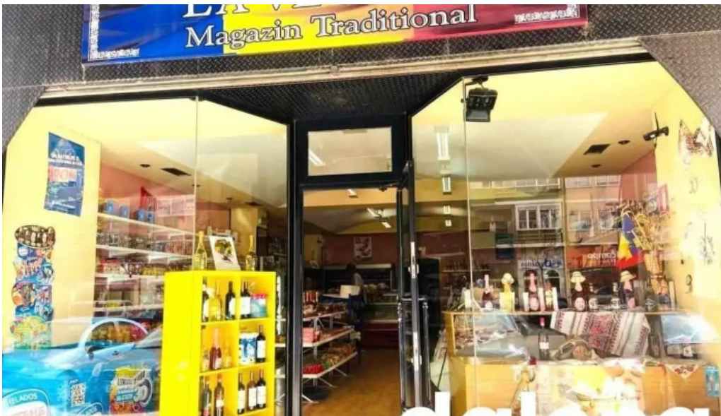
Magazin la vecinu burgos