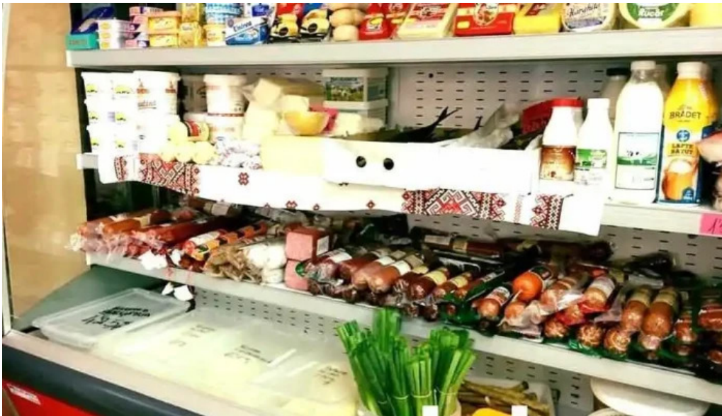
Magazin la vecinu zona