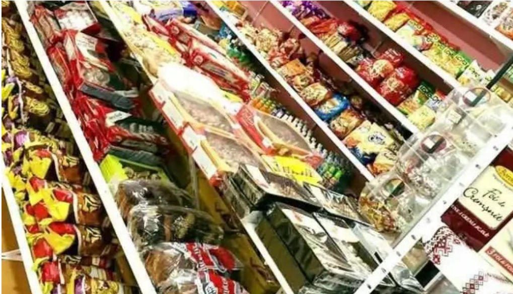
Magazin la vecinu interior