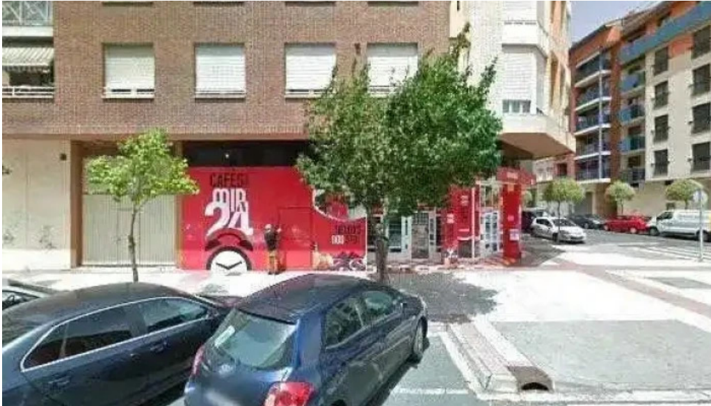
Abierto 25 horas descuentosdeg