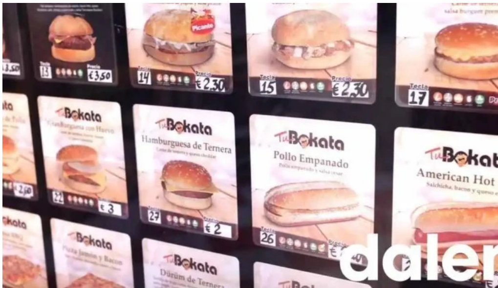
Abierto 25 horas interior