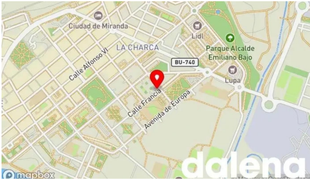
Abierto 25 horas mapa