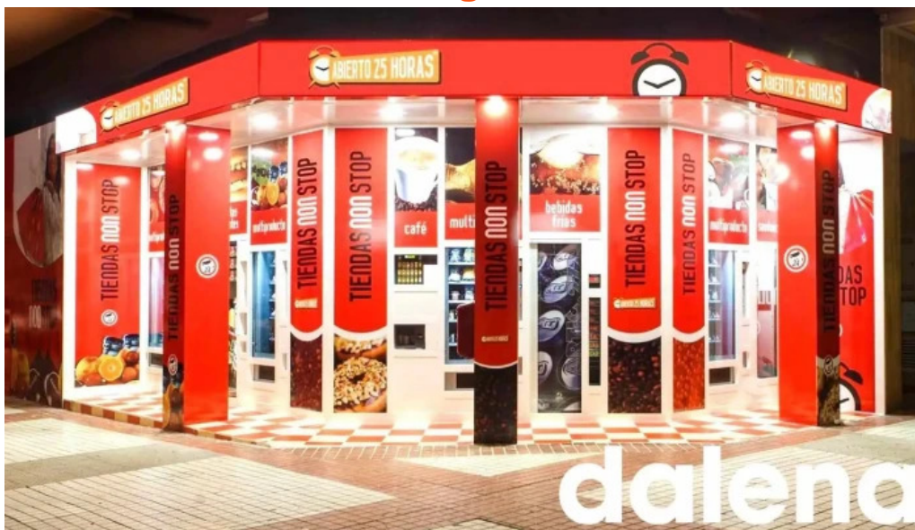
Abierto 25 horas miranda de ebro