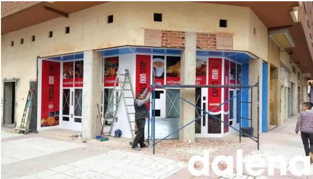
Abierto 25 horas descuentos