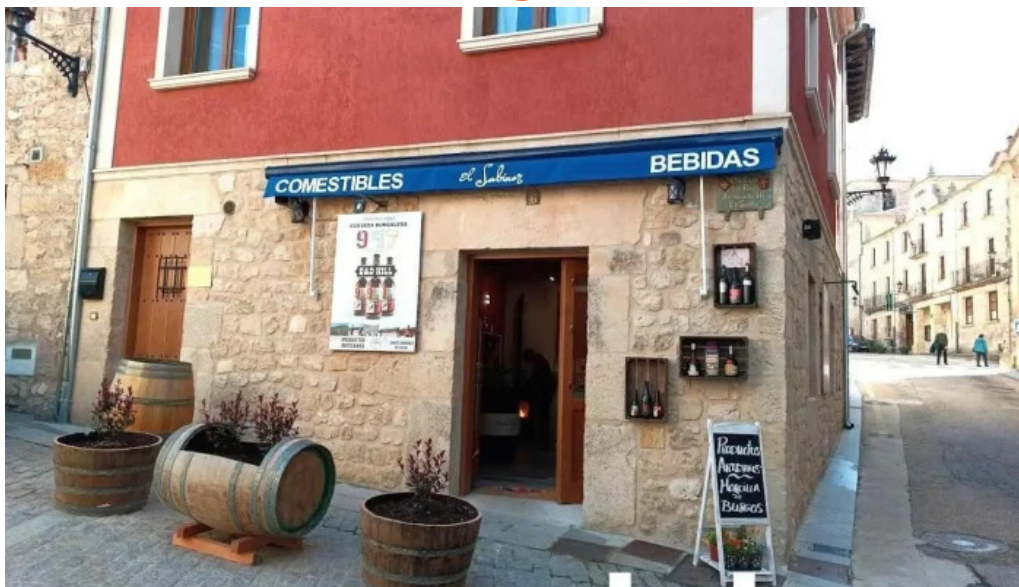
El sabinar santo domingo de silos