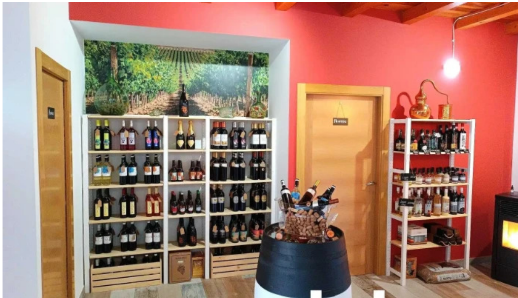
El sabinar interior