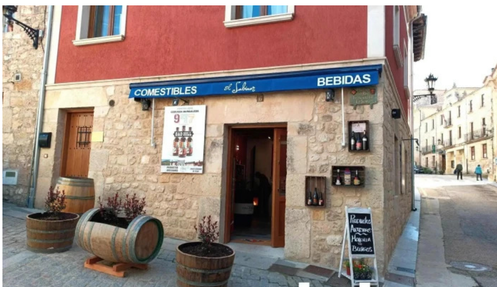
El sabinar abierto ahora