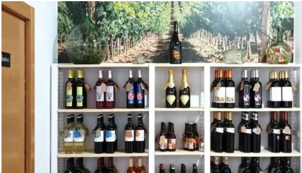
El sabinar del propietario