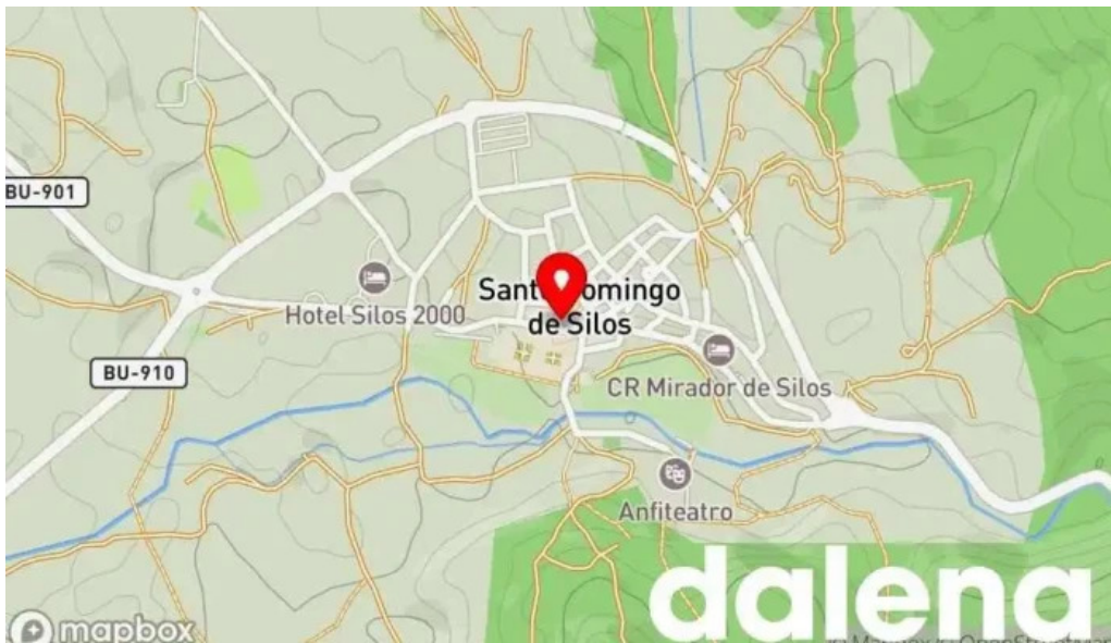
El sabinar mapa