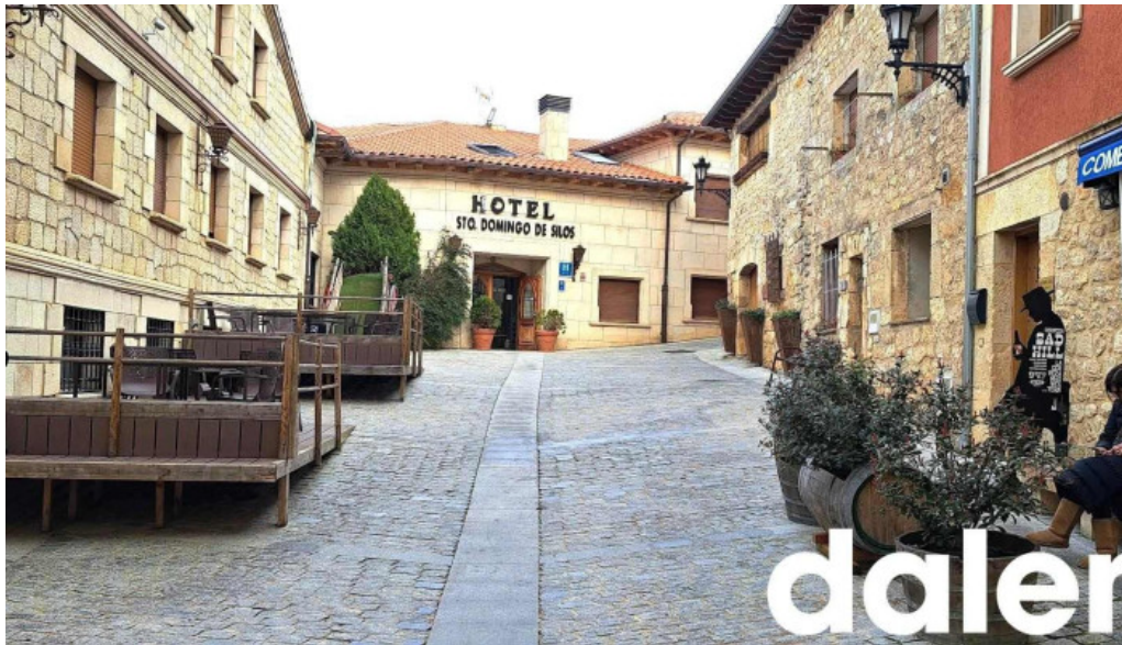
El sabinar mas recientes