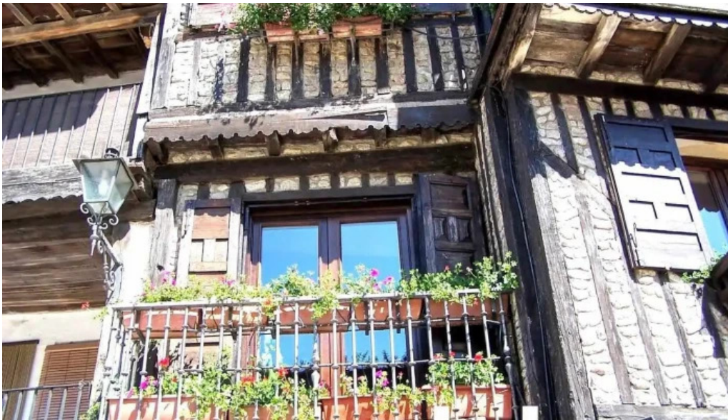
Ciripolen las mestas