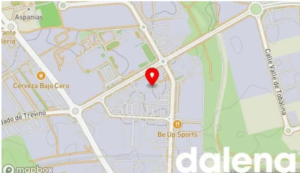
La especiera del norte burgos