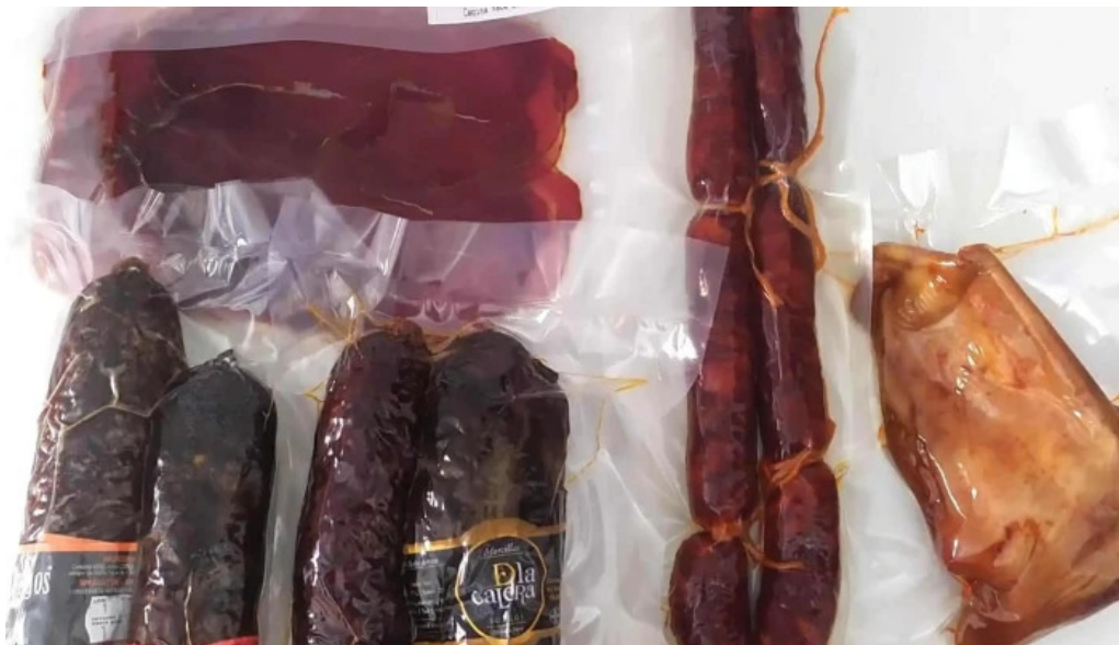
La olla podrida burgos descuentos