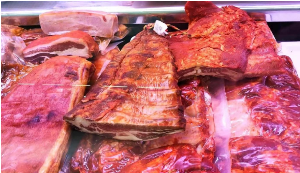
La olla podrida burgos cerca de mi