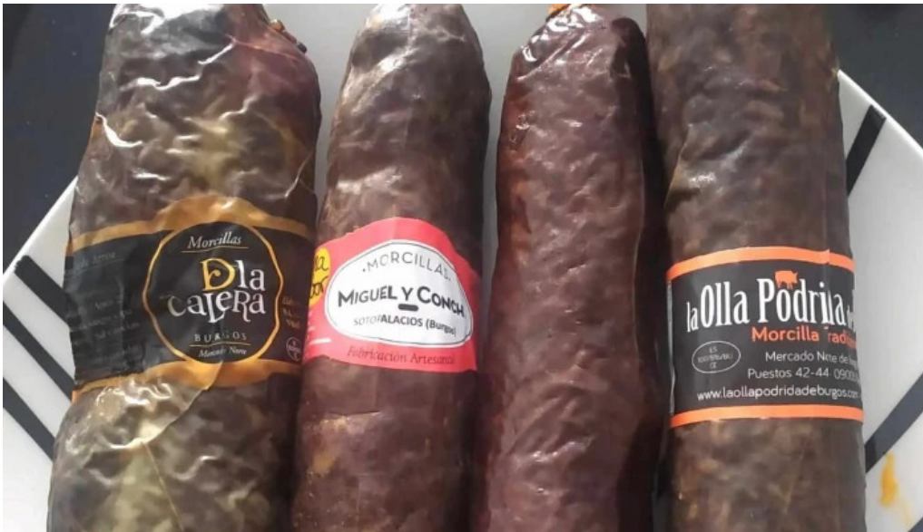
La olla podrida burgos comentarios