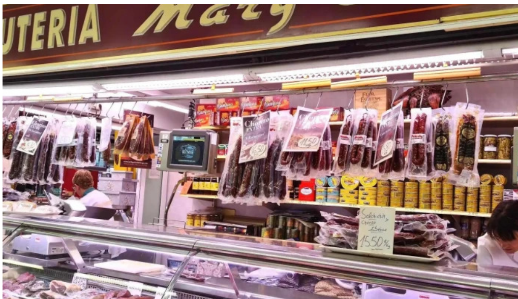
La olla podrida burgos como llegar