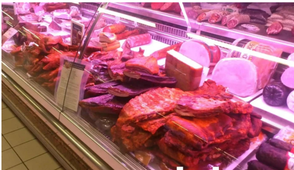
La olla podrida burgos carne