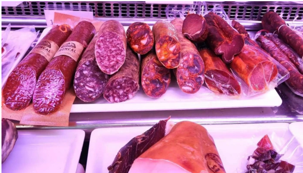
La olla podrida burgos puntaje