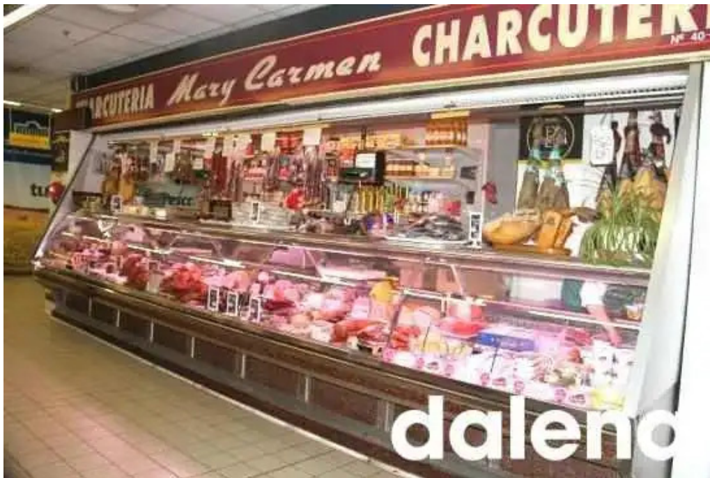
La olla podrida burgos interior