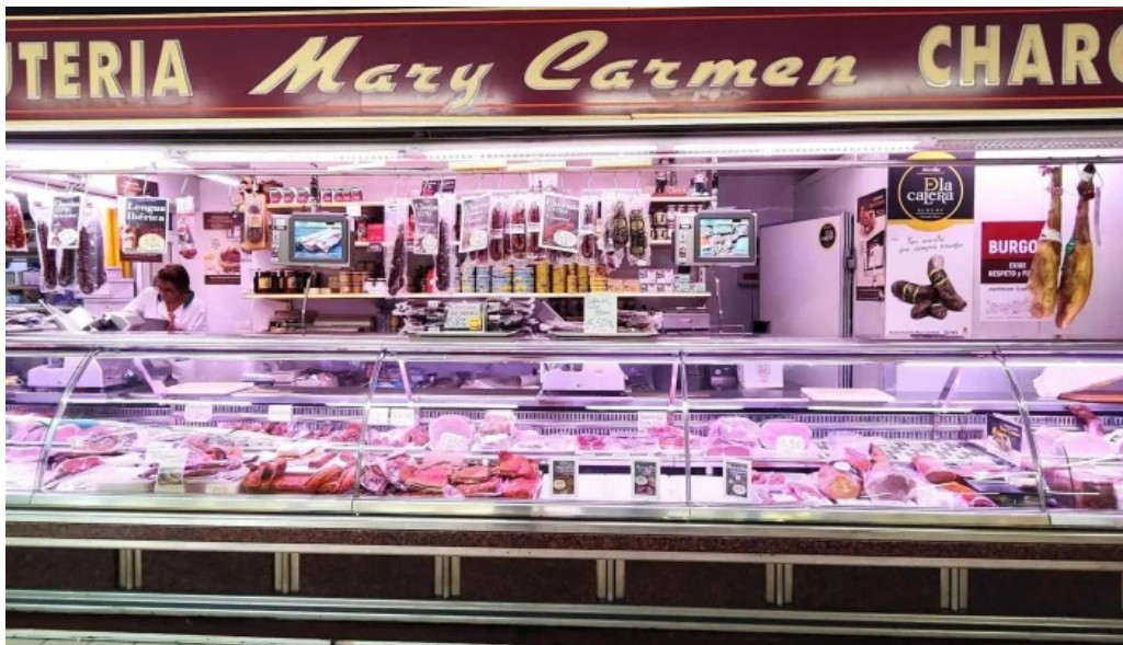
La olla podrida burgos videos