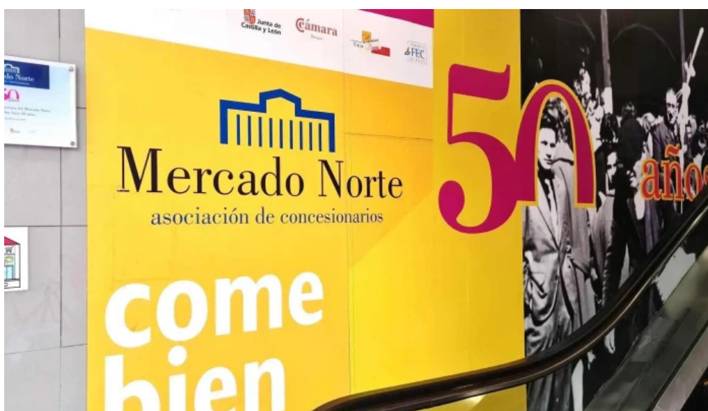
La olla podrida burgos burgos