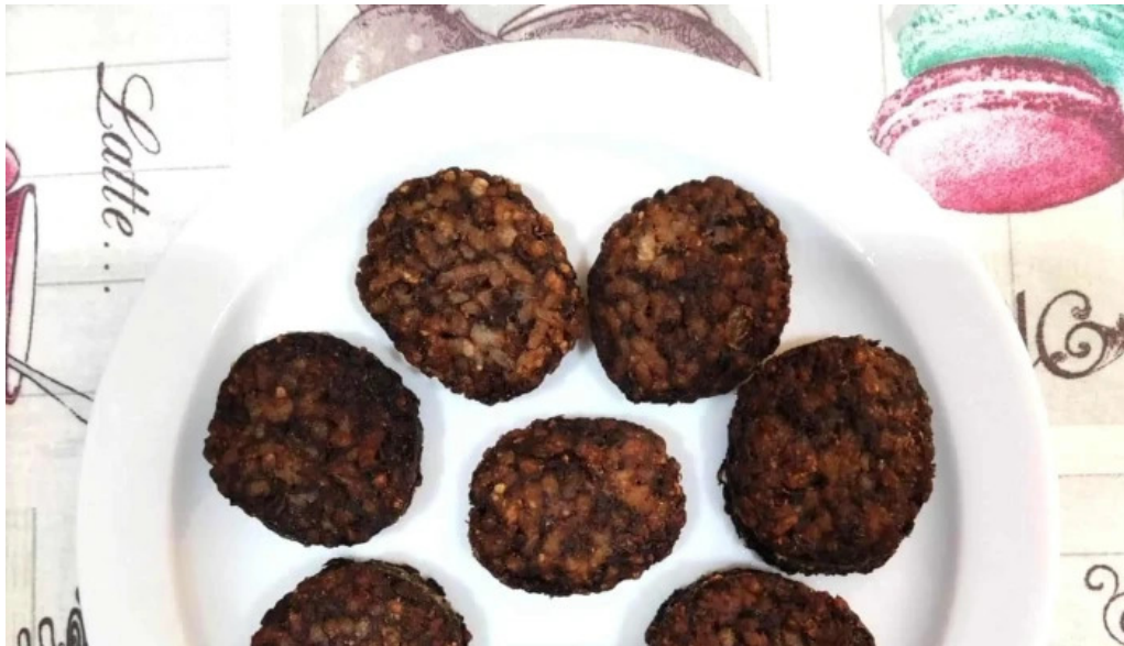
La olla podrida burgos direccion