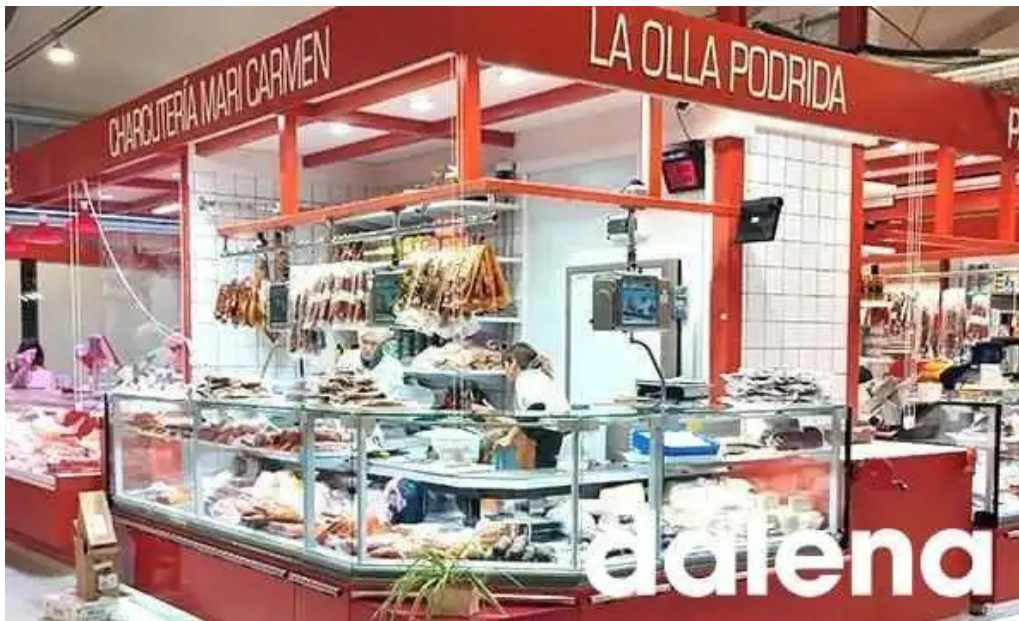
La olla podrida burgos del propietario