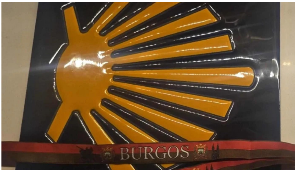
Regalos el peregrino zona