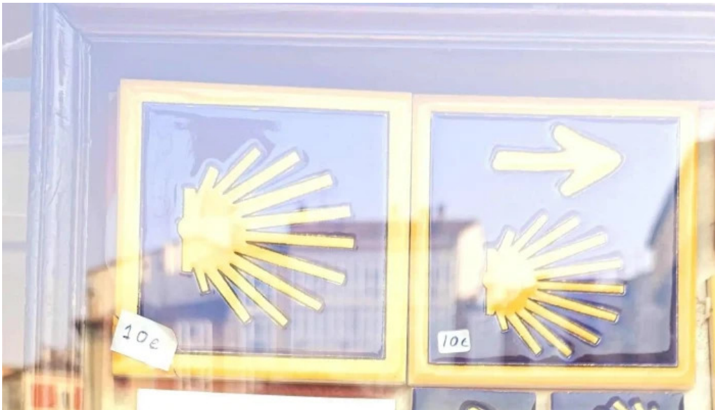
Regalos el peregrino catalogo