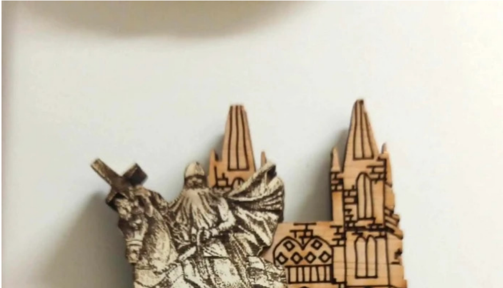
Regalos el peregrino burgos