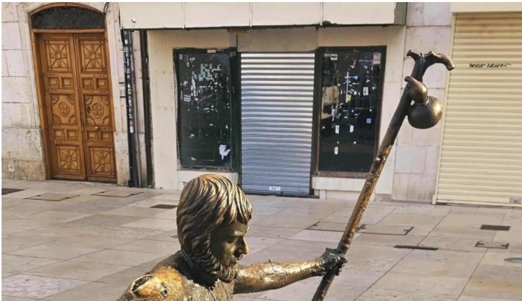
Regalos el peregrino opiniones