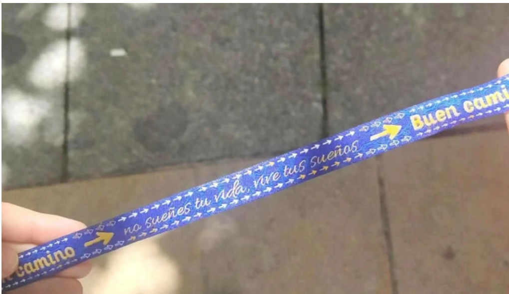
Regalos el peregrino numero