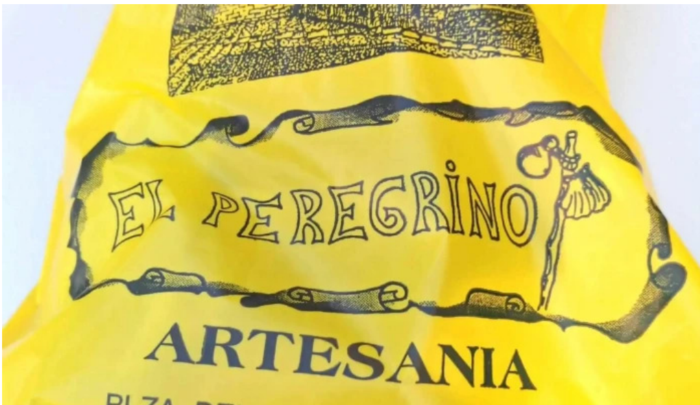
Regalos el peregrino puntaje