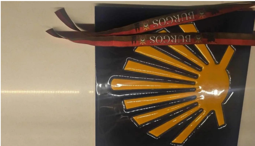
Regalos el peregrino sitio web