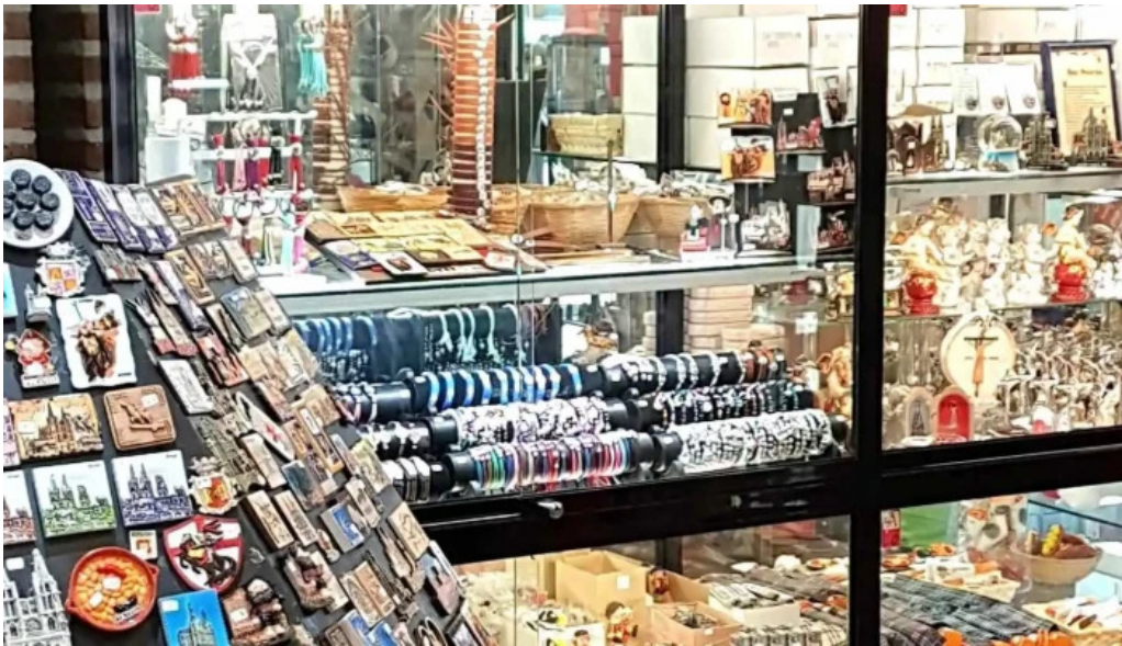
Regalos el peregrino interior