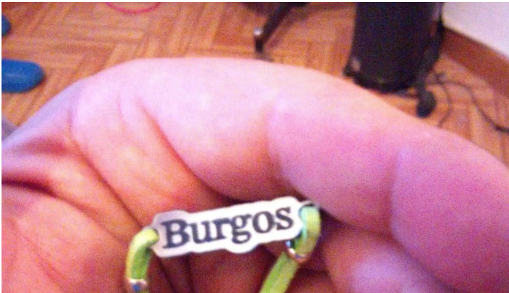
Regalos el peregrino horario