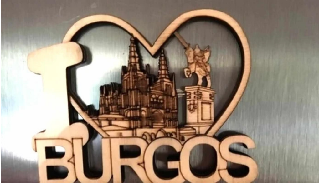
Regalos el peregrino instagram