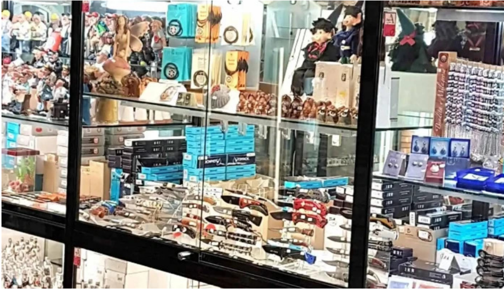
Regalos el peregrino del propietario